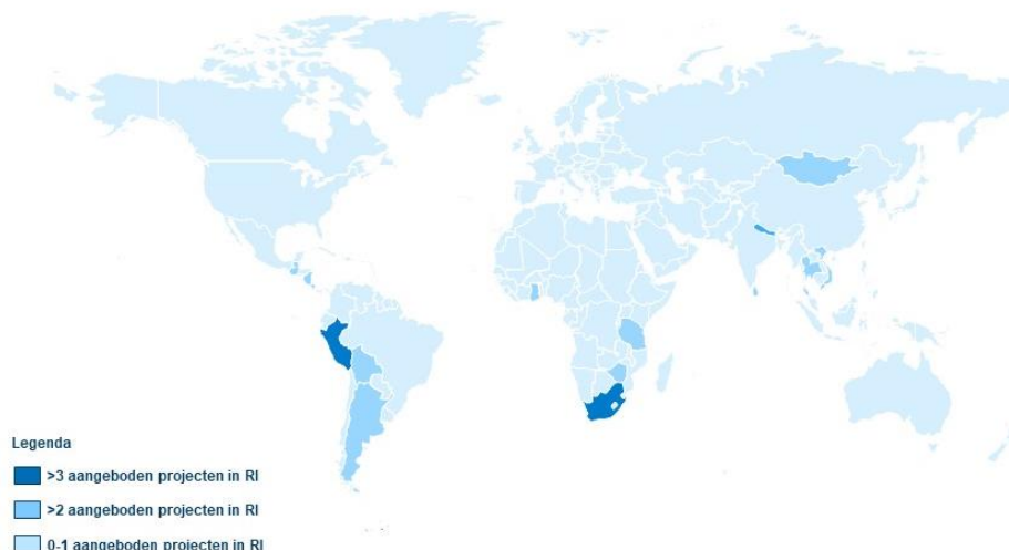
Figuur 5.1 Vrijwilligersprojecten in residentiële instellingen (RI) (overzicht van landen) (N = 15)

Dit beeld komt ook overeen met eerdere bevindingen uit het BCNN onderzoek. 176 Omdat er geen volledig beeld bestaat van de particuliere initiatieven, worden deze niet meegeteld in bovenstaande opsomming. Echter, anekdotisch bewijs toont dat deze projecten zich op min of meer dezelfde landen en regio's richten. Daarnaast zijn er voorbeelden van particuliere initiatieven (residentiële projecten) in Oost-Europa. De onderstaand figuur illustreert de bovenstaande data en is gebaseerd op de data die gevalideerd is met aanbiedende partijen. Er kan met zekerheid gesteld worden dat vanuit Nederland in ieder geval vrijwilligersreizen naar residentiële zorginstellingen in onderstaande landen worden aangeboden. De legenda toont dat zich in sommige landen (o.a. Peru) meerdere projecten in residentiële instellingen bevinden waarnaar reizen worden aangeboden. Mogelijk is de geografische spreiding van het aanbod van vrijwilligersreizen naar residentiële zorginstellingen voor kinderen breder dan onderstaande afbeelding weergeeft. Echter, dit kan op basis van dit onderzoek niet bevestigd worden. Kijkend naar de vergaarde gegevens van aanbieders kan wel geconcludeerd worden dat vrijwilligersreizen naar projecten met kinderen (niet louter residentiële zorginstellingen) veelal gericht zijn op Zuid-Amerika, Afrika en Zuidoost Azië.