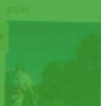
Wandelen in de Pyreneeën