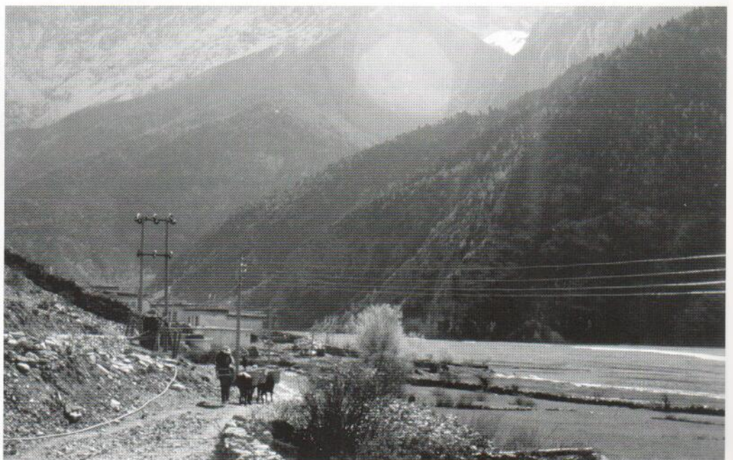
Annapurna regio, Nepal

Hier wordt eerst gekeken naar Natourdata uit het oogpunt van natuurbescherming. In aansluiting daarop wordt de waarde van Natourdata als toeristisch product onder de loep worden genomen, waarbij het vooral gaat 'hoe kan de natuurinfor-