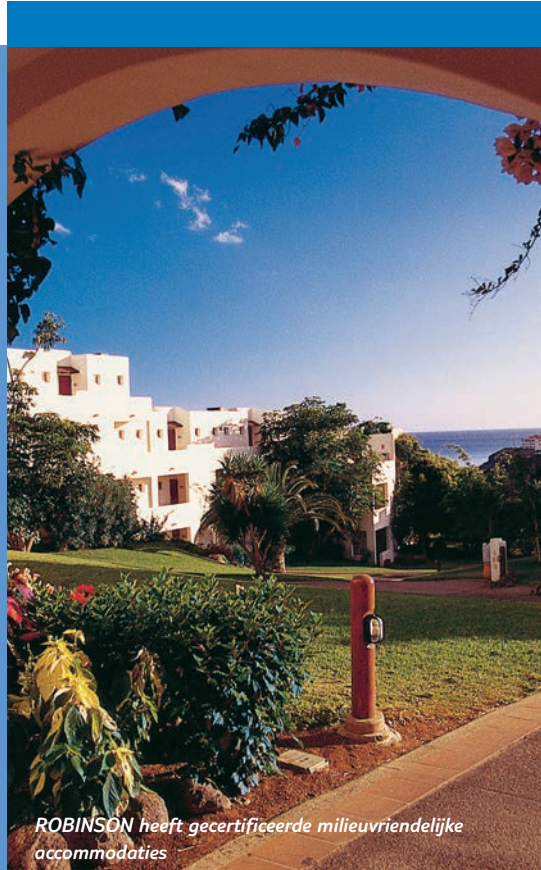
ROBINSON heeft gecertificeerde milieuvriendelijke accommodaties

Op dit moment hebben we nog onvoldoende inzicht in onze ketenpartners; iets waar snel verandering in moet komen. Een eerste maatregel hiervoor is het opnemen van duurzaamheidsclausules in contracten, waarbij controle op het naleven uiteraard van groot belang is. Daarom gaan we in 2009 werken met Travelife Sustainability System, een onafhankelijk Europees systeem waarin aanbod kan worden opgevoerd en geëvalueerd. Zo krijgen onze productmanagers steeds meer inzicht in de duurzame kwaliteit van hun vakantieproducten.