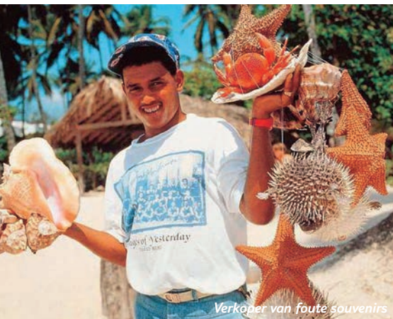
Verkoper van foute souvenirs