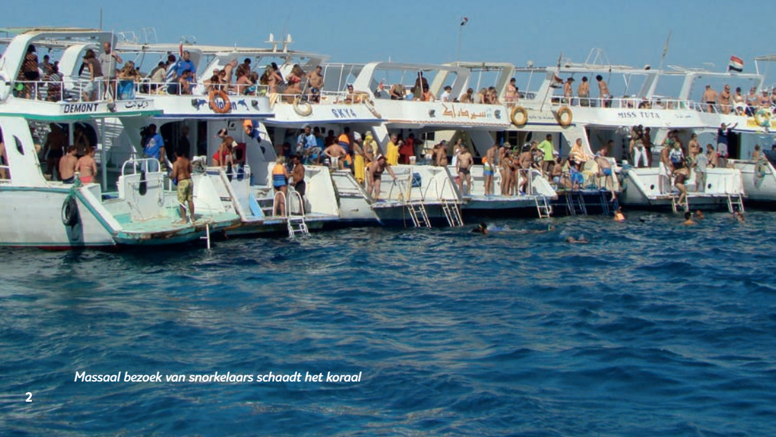
Massaal bezoek van snorkelaars schaadt het koraal

We voelen ons medeverantwoordelijk voor de toekomst van onze vakantiebestemmingen. We richten ons daarom op vakanties met respect voor mens, dier en natuur.