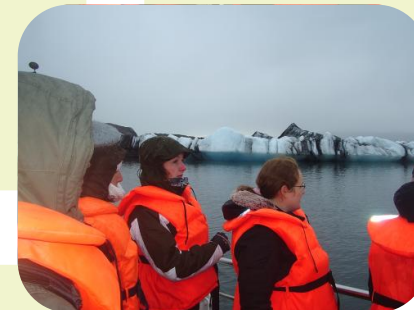
Foto: Boottocht op Jökulsárlon, de zwarte strepen in de ijsschotsen zijn vulkanische afzettingen welke als een "streepjes code" informatie leveren over de geschiedenis van omliggende vulkanen.

Jökulsárlon, een sprookjesachtig IJslands gletsjermeer is een kwetsbare en spectaculaire bestemming voor "Nature Based Tourism" en wordt daarom door de HTRO Studenten van InHolland Haarlem in de minor Landschappen als onderzoeksterrein bezocht. Het onderzoek wordt gedaan met behulp van het DPSIR model, aanbevolen door de European Environmental Agency. DPSIR staat voor Driver, Pressure, State, Impact & Response, waarbij de "state" ecosysteem diensten levert aan de mensheid in het algemeen, en een inkomstenbron voor de ondernemers in het "nature based tourism" in het bijzonder (Kristensen, P. 2004). Op IJsland is de druk op het milieu door de opwarming van de aarde, zichtbaar in het tempo van het smelten van de gletsjer, en hoorbaar door het afbreken van ijsschotsen. De toerisme studenten nemen interviews af en vergelijken de antwoorden van ondernemers en overheden, in IJsland en Nederland.