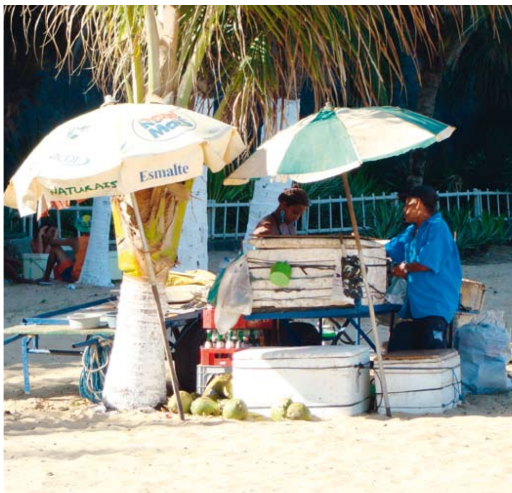
Lokale bedrijvigheid op het strand nabij Puerto Plata.

menten van de deelnemende reisorganisaties achtergrondinformatie over onze organisatie verstrekt. Door deel te nemen aan ons initiatief kunnen organisaties ook hun maatschappelijke betrokkenheid tonen'. Doelstelling van TFNL -naast een positieve bijdrage leveren aan de lokale bevolking, natuur, cultuur en economie- is het ontwikkelen en opzetten van projecten in diverse vakantiebestemmingen. Pepping: 'Ons eerste project is begin 2008 gelanceerd. In Egypte ontwikkelden wij plannen ter behoud van de Rode Zee, dat vooral bekend staat als een duik- en snorkelbestemming. Echter, duiken kan schadelijke gevolgen hebben voor bijvoorbeeld het koraal. Vorig jaar hebben wij speciale trainingen ontwikkeld voor duikinstucteurs in Egypte, waarbij niet alleen het behoud van het koraal aan de orde komt, maar instructeurs ook worden getraind om de (duik)toeristen hierover te informeren en te vertellen hoe zij verantwoord kunnen duiken. Voor deze projecten werken wij nauw samen met reisorganisaties en hun lokale agenten. Dat werkt uitstekend'.