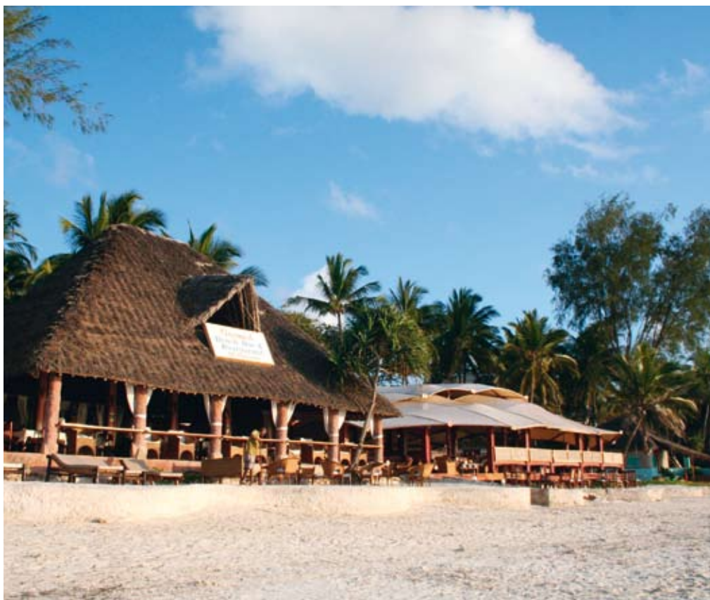
Om in de toekomst reizen ook goed en zo verantwoord mogelijk te maken, is de ANVR samen met haar leden sinds 1995 actief op het gebied van duurzaam toerisme.