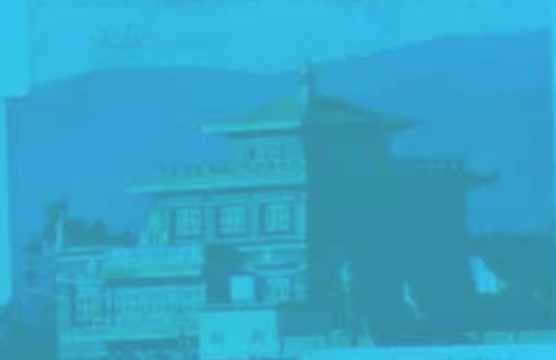
Wanhsienhuo in Shanxi