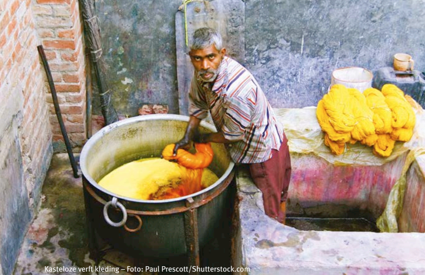
Kasteloze verft kleding – Foto: Paul Prescott/Shutterstock.com

Het verschil is groot met het platteland, waar het oude systeem vaker standhoudt. Verhalen over groepen dalits die buiten de dorpskern moeten wonen en geen gebruik mogen maken van de dorpsput bestaan nog steeds. Of dalits wiens land simpelweg afgenomen wordt, zonder dat iemand er iets tegen kan doen. Aangiftes bij de politie worden niet serieus genomen, rechtszaken leveren zelden een dalit als winnaar op.