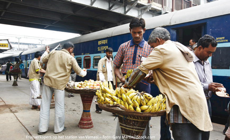
Fruitverkopers op het station van Varnasi

zoete melkthee langs de ramen. Maar daar blijft het niet bij. Het station is als een markt met kooplui die hun waar aanprijzen. Ze verkopen fruit, limonade, versgebakken omelet met toast, gefrituurde pannenkoeken, bananen, appels, mandarijnen, opblaas-kussens en lakens om onder te slapen. Ook kranten, boeken en tijdschriften worden aan het open raam van de trein verkocht. Tijdens de tussenstop is er alle tijd om over het perron te wandelen. Passagiers vullen hun waterflessen aan de kraan en verdringen zich om de eetstalletjes. Koeien eten de gevallen etensresten van de vloer. Bij een ongereserveerde wagon proberen mensen zich naar binnen te wringen terwijl ze elkaar verrot schelden. Door de spijlen van de kleine ramen heen zien we hoe vol het binnen is. Er zitten zelfs mensen naast elkaar in de bagagehouders boven de houten banken. Tegen de avond komt een man in grijs uniform langs en vraagt wie er dinner wil. We kunnen kiezen tussen vegetarian of non-