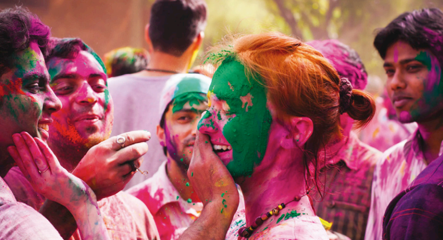
Indiase studenten laten toeriste kennismaken met Holi

bevolking. Winkels hangen al weken vol met glitter en glamour, cadeaus moeten vooral duur en uniek zijn. Een doosje zelfgemaakt snoep, zoals dat vroeger geschonken werd, is niet goed genoeg meer.