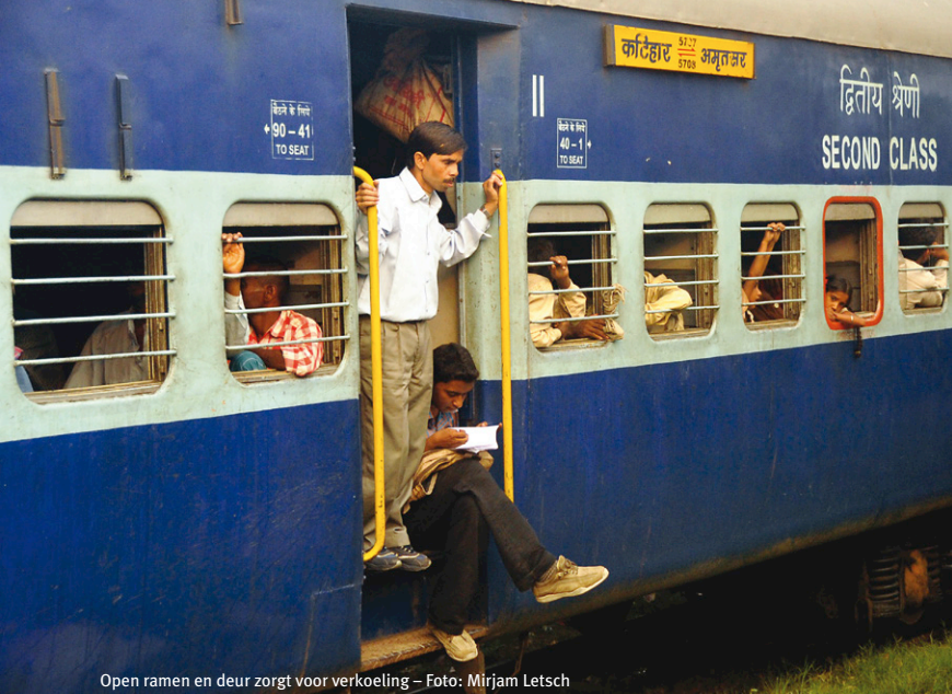
Open ramen en deur zorgt voor verkoeling

schoenpoetsers, handelaren en werkende kinderen de wagon binnen. Een man draait puntzakjes van schoolschriftblaadjes waarin hij geroosterde kikkererwten verpakt.