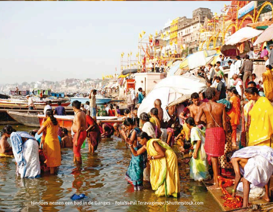
Hindoes nemen een bad in de Ganges – Foto's: Pal Teravagimov/Shutterstock.com