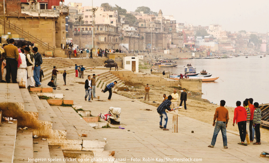
Jongeren spelen cricket op de ghats in Varanasi

Toch is er ook kritiek, met name op de commercialisering van de sport. Juist omdat alle sponsors gefocust zijn op cricket, verliezen andere sporten in India terrein, waaronder hockey. Zelfs de minister van Sport zei afgelopen jaar: “Televisie, commercialisering en de advertentiemarkt hebben cricket tot ongekende hoogten gepromoot alsof het de Mount Everest is, wat uiteindelijk andere sporten in het land negatief beïnvloedt.”