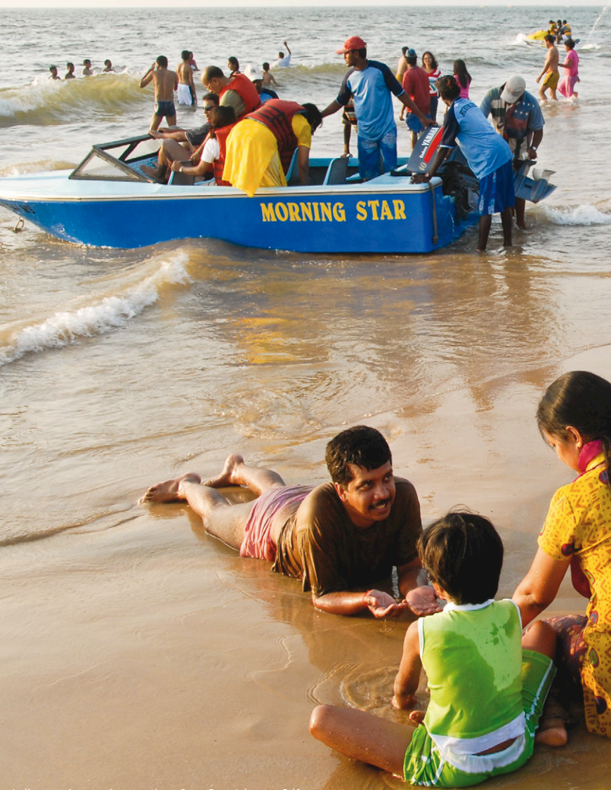
Indiase toeristen op het strand van Goa