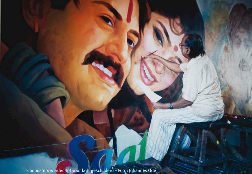
Filmposters werden tot voor kort geschilderd

moderne relaties. Het gaat over samenwonen, zwangerschap en het ouderschap. De film speelt zich af in Australië en laat veel scènes zien op het strand, met opnieuw veel bloot. Het is de eerste film waarin een acht maanden zwangere actrice rondanst. Meer recent werd in The Dirty Picture het leven van een Zuid-Indiase actrice uit de jaren '80 vertoond die bekend stond om haar erotische scènes en die vele taboes rond seksualiteit openlijk aan haar laars lapte. Zoals de titel al doet vermoeden, opnieuw geen familiefilm.