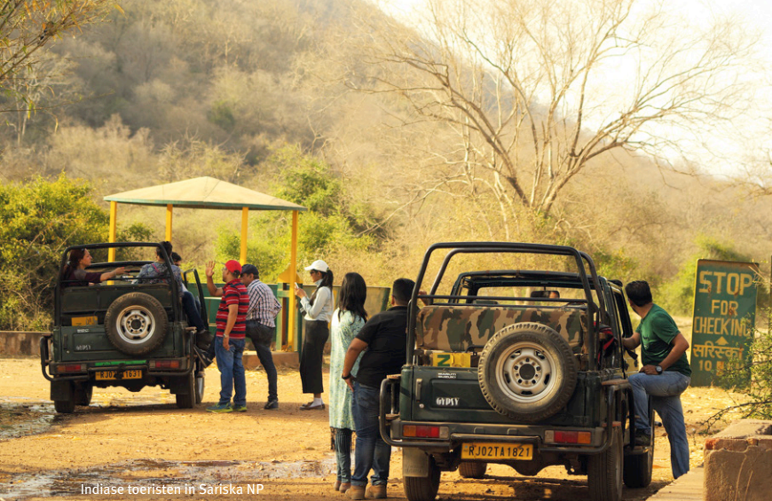
Indiase toeristen in Sariska NP