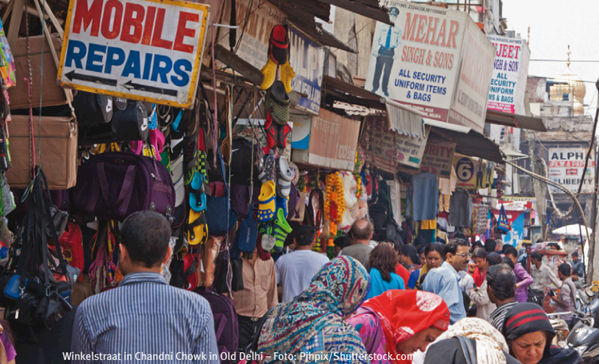
Winkelstraat in Chandni Chowk in Old Delhi