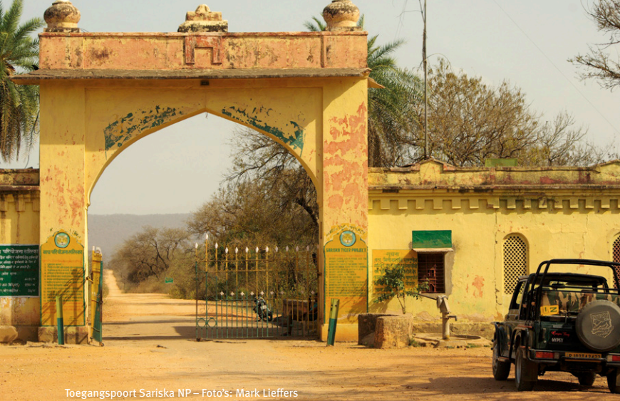
Toegangspoort Sariska NP

en Vietnam, worden steeds hogere prijzen betaald voor tijgers. Hun lichaamsdelen worden verwerkt in traditionele Aziatische medicijnen en gerechten, en gelden als statussymbolen voor de nieuwe rijken. Ook op neushoorns, olifanten en schubdieren wordt gejaagd vanwege ivoor en andere lichaamsdelen, waardoor ze dreigen uit te sterven.