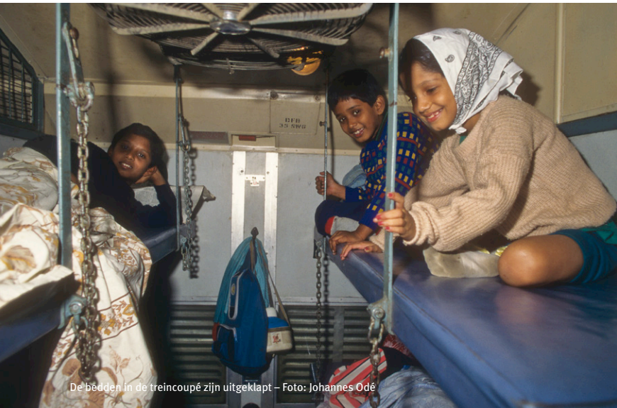
De bedden in de treincoupé zijn uitgeklaapt – Foto: Johannes Odé

Na 26 uur reizen zijn we aangekomen in Bangalore, ruim 1200 kilometer van Mumbai. Met stof tot onder de kleren en verdoofd in het hoofd van het treingeraas verlangen we naar een verkoelende douche en schone lakens.