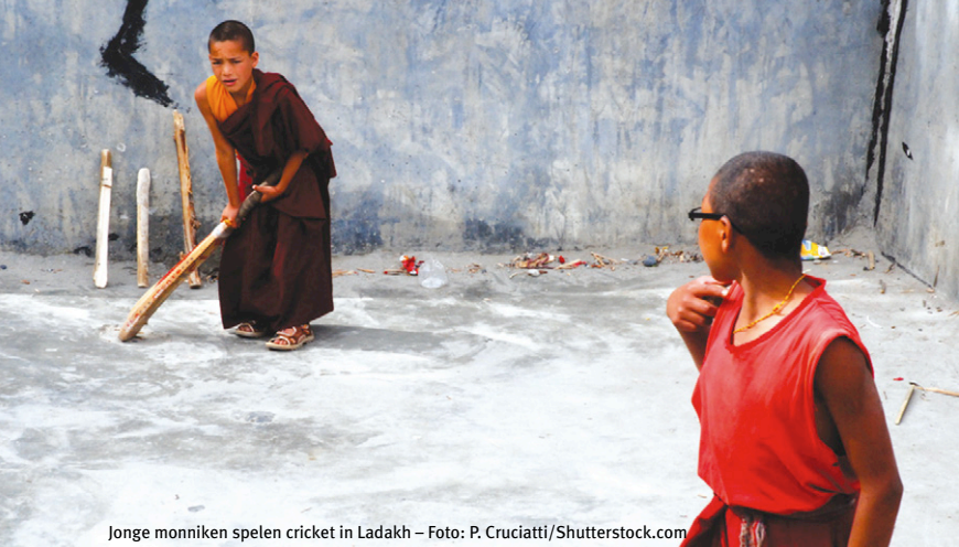
Jonge monniken spelen cricket in Ladakh