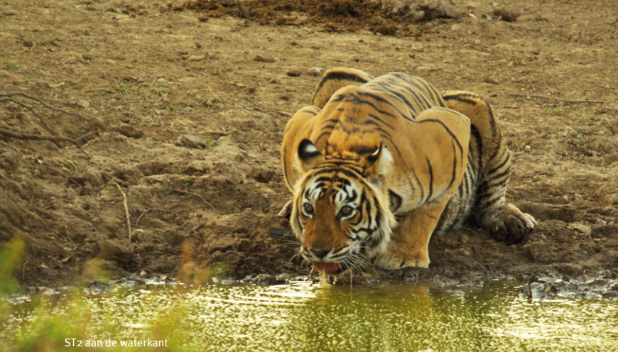
ST2 aan de waterkant

land en die ook willen beschermen. Als ik om me heen kijk realiseer ik me dat ik de enige niet-Indiër bij ST2 ben. Dat, en vooral het grote aantal enthousiaste kinderen, maakt de ontmoeting met deze tijgerin nog mooier! In het begin lijkt ST2 wat rusteloos, ze draait van haar ene op de andere zij in het water. Dan likt ze haar voorpoot schoon en gaat haar kop omhoog. Ze volgt de vlucht van een slangenarend. Gewoon tijgergedrag, maar voor ons allemaal zo bijzonder om te zien! Enkele pauwen en een wild zwijn kijken vanaf een veilige verre oever toe. De dieren gedragen zich heel ontspannen, ze weten dat het machtige roofdier op dit moment alleen maar dorst heeft en afkoeling zoekt. Na ongeveer een kwartier besluit de tijger dat de show voorbij is. Terwijl het zwarte water van haar lichaam druipt, loopt ze naar de oever, kijkt nog even om en verdwijnt dan het bos in. Inmiddels is het zes uur 's avonds. Vanaf dit tijdstip, als de hitte langzaam wegtrekt en de schemering komt, is het tijd om te gaan jagen.