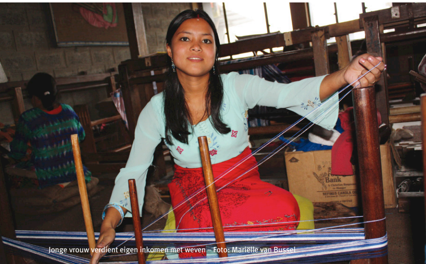
Jonge vrouw verdient eigen inkomen met weven

Maar ook op het platteland grijpen vrouwen de kans om iets aan hun situatie te doen. In steeds meer dorpen verenigen vrouwen zich in zelfhulpgroepen, die vaak begeleid worden door een plaatselijke NGO (niet-gouvernementele organisatie) met meestal opgeleide vrouwen aan het roer. In deze zelfhulpgroepen bespreken en delen vrouwen hun problemen en denken ze na over de manier waarop ze minder afhankelijk kunnen zijn.