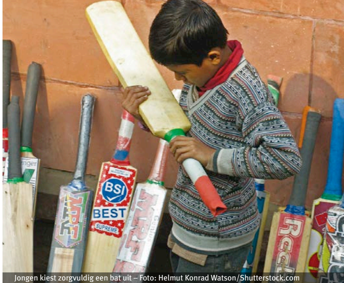
Jongen kiest zorgvuldig een bat uit

sterspelers ingevlogen, afkomstig uit bijvoorbeeld Australië, Engeland en Nederland.