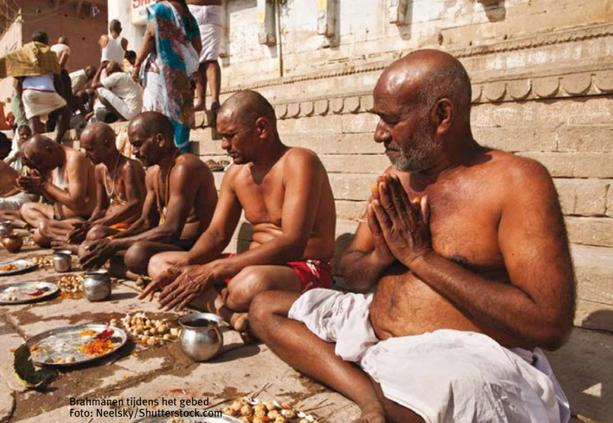
Brahmanen tijdens het gebed

Neem bijvoorbeeld de zilversmid: een subkaste van een subkaste van een subkaste die uiteindelijk onder de kaste van de handwerkslieden ( shudra's ) valt, één van de vier hoofdkasten. Behalve de handwerkslieden heb je ook de kaste van de priesters ( brahmanen ), de krijgers ( kshatriya's ) en de handelaren en boeren ( vaisha's ). Er is ook nog een grote groep mensen, een vijfde van de bevolking, die niet in een van deze vier hoofdkasten past: de kastelozen, ofwel de onaanraakbaren ( dalits ).