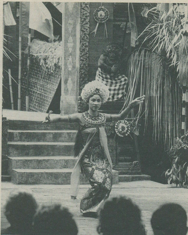
Danseres op Bali.